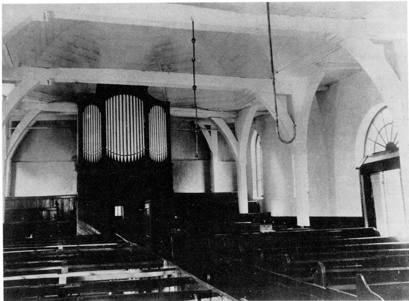
Nijveen, Herv. kerk, oudste situatie. – De kerk, constructief gebouwd als een Drenthse boerderij, had daardoor een zodanige kapconstructie, dat het aan de torenkant staande orgel geplaatst leek te zijn in een koorsluiting.

grote, enigszins grof uitgevoerde kas met een driedelig front – sprekend middenveld, loze zijvelden met imitatiepijpen –, waarbij het inwendige schuiling achter het middenveld en de klaviatuur zich, vanuit de kerk gezien, achter het rechter pijpenveld aan de zijkant van de kas bevond. Een aantekening op de kas vermeldde Proper als bouwer van het orgel.