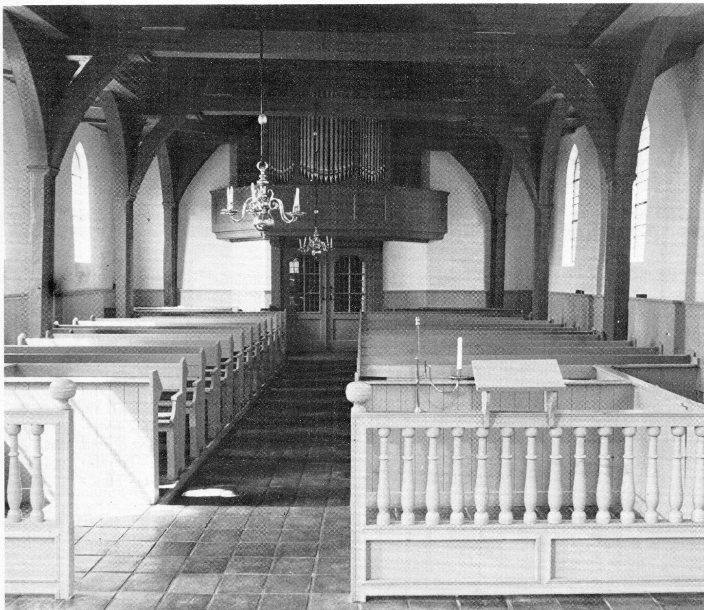
Nijeveen, Herv. kerk. – Situatie vóór de reconstructie van het orgel.