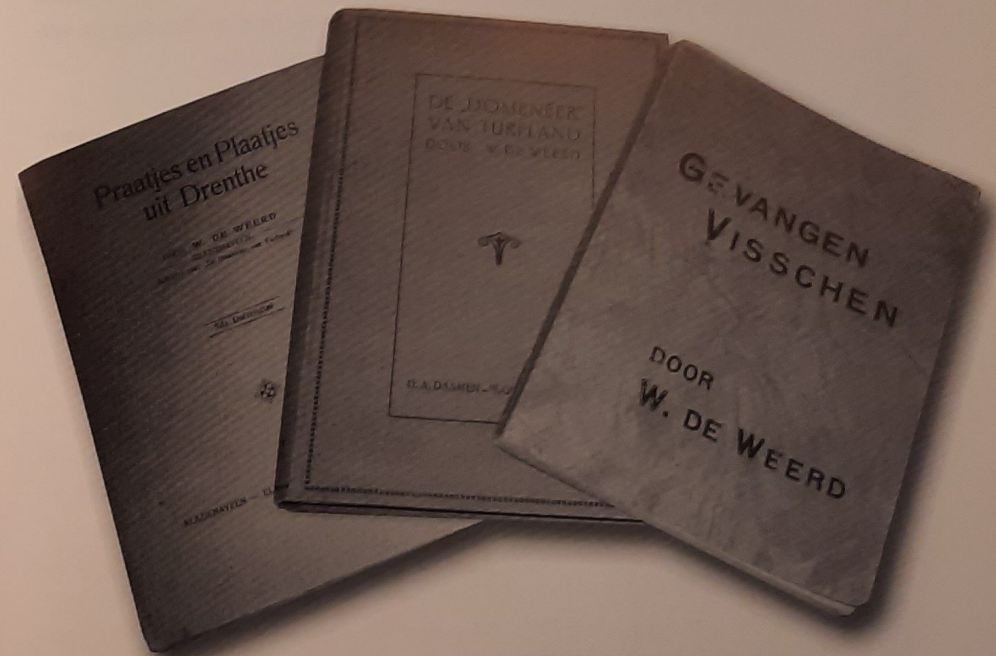
Voorkant van de drie papieren collectanten.