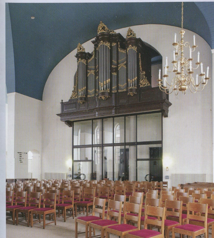
Restauratie Van Dam-orgel 2016 Jozefkerk Assen