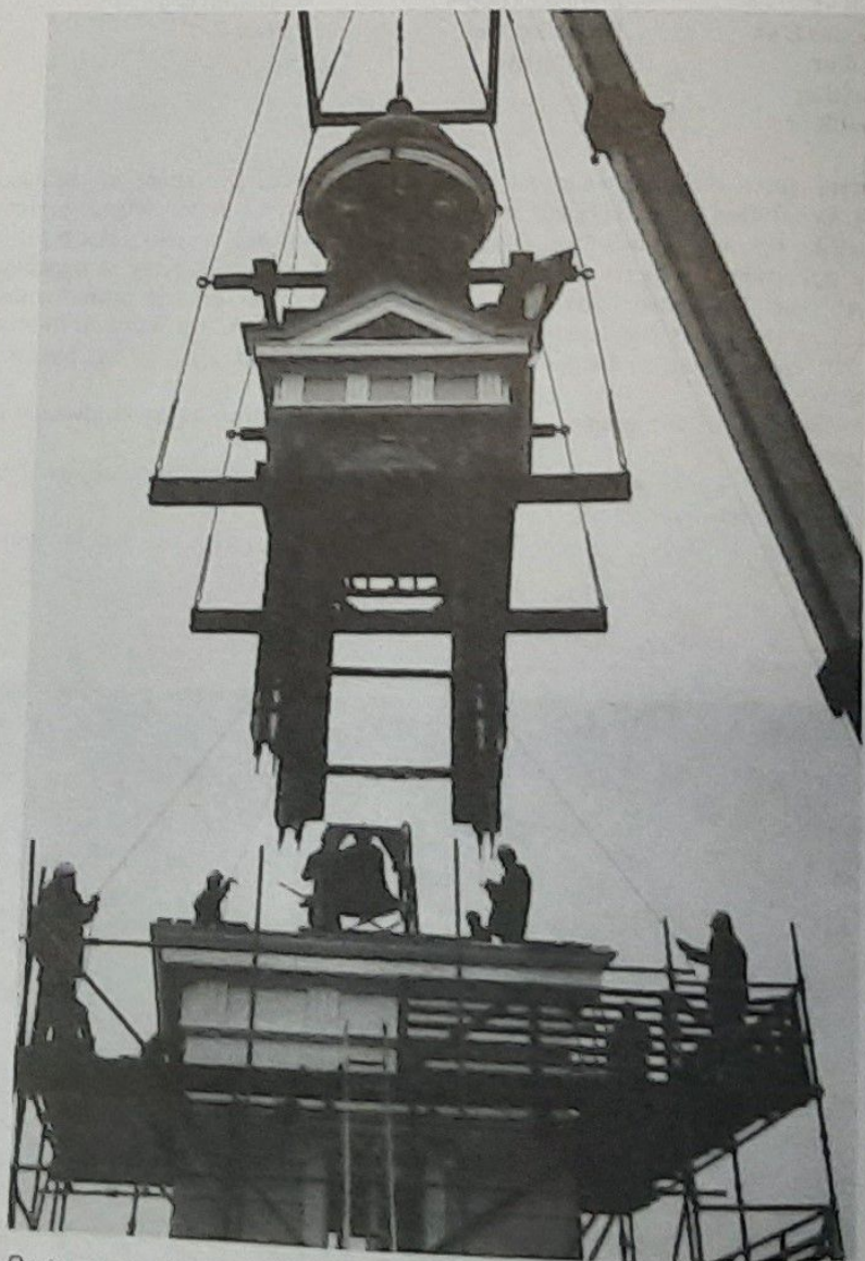
De toren wordt op z'n plaats gezet!