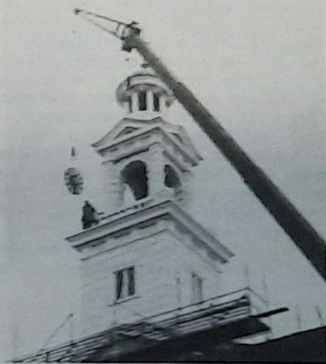
Zo gingen ze weer naar boven