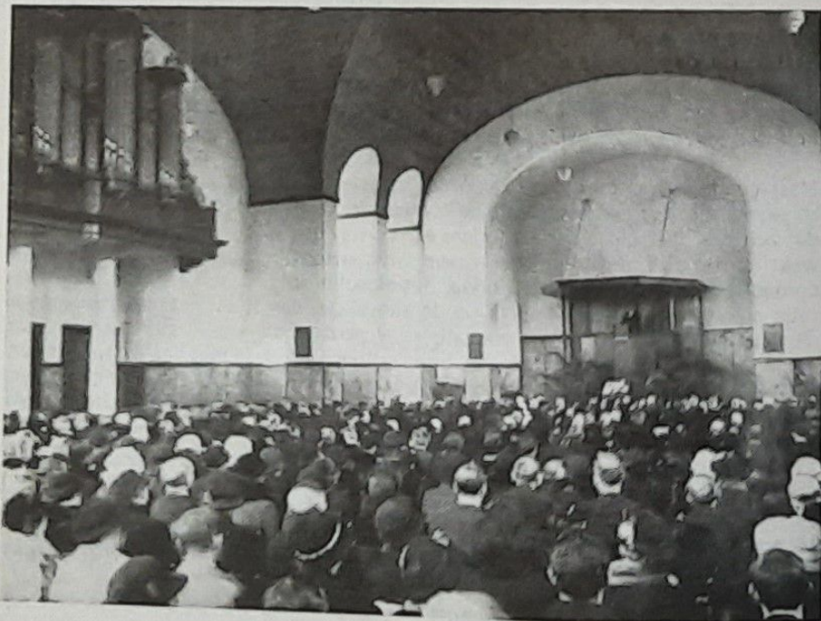
Inwijdingsdienst in 1938