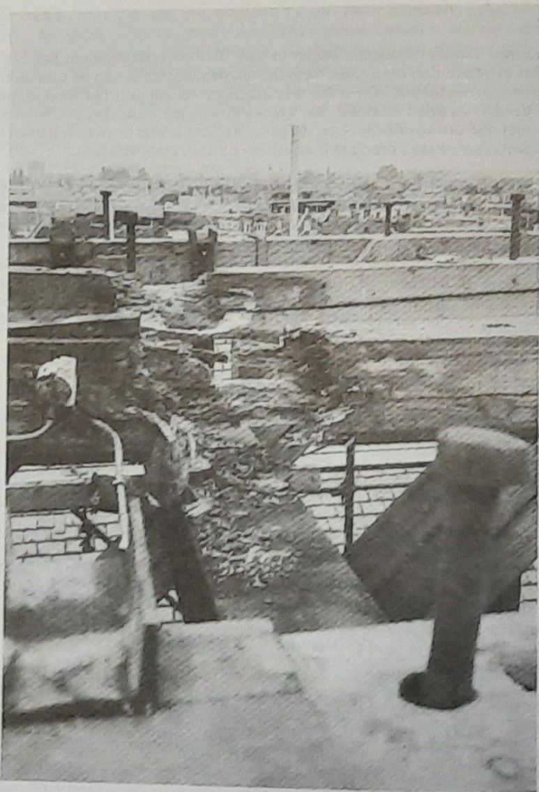
Het was niet overbodig!

Na uitvoerige besprekingen met o.a. de inspraakgroep uit de wijkgemeente Holt-Esch, werden ook de plannen voor het interieur ontwikkeld. Deze voorbereiding heeft veel tijd gevraagd. Diverse mogelijkheden zijn uitgetekend en besproken. Ik ben van mening dat, gezien het resultaat, de uiteindelijke keus een goede is geweest. De totale kosten voor het interieur, inclusief de inrichting doch exclusief de restauratie van het orgel, hebben circa f 1.100.000,- bedragen.