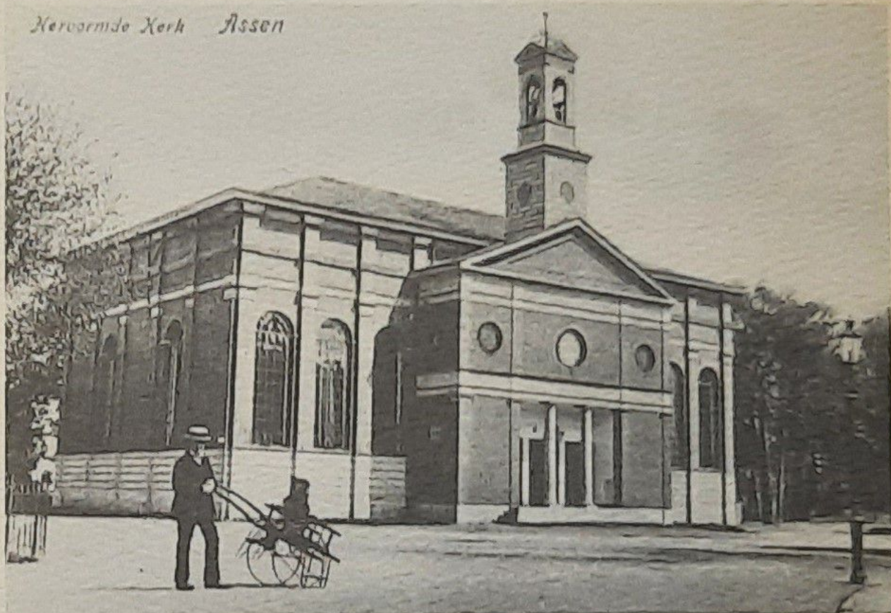
De Jozefkerk voor juli 1910