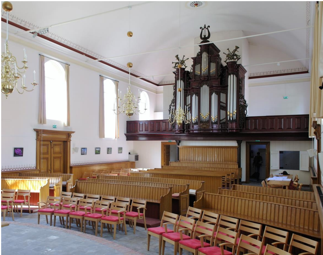
Het orgel en het orgelbalkon in het schip van de kerk