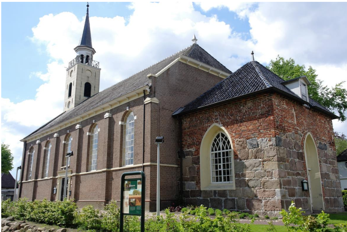
Exterieur van de kerk, met rechts de consistorie, het voormalige koor, waarvan het onderste deel is opgebouwd uit zwerfkeien