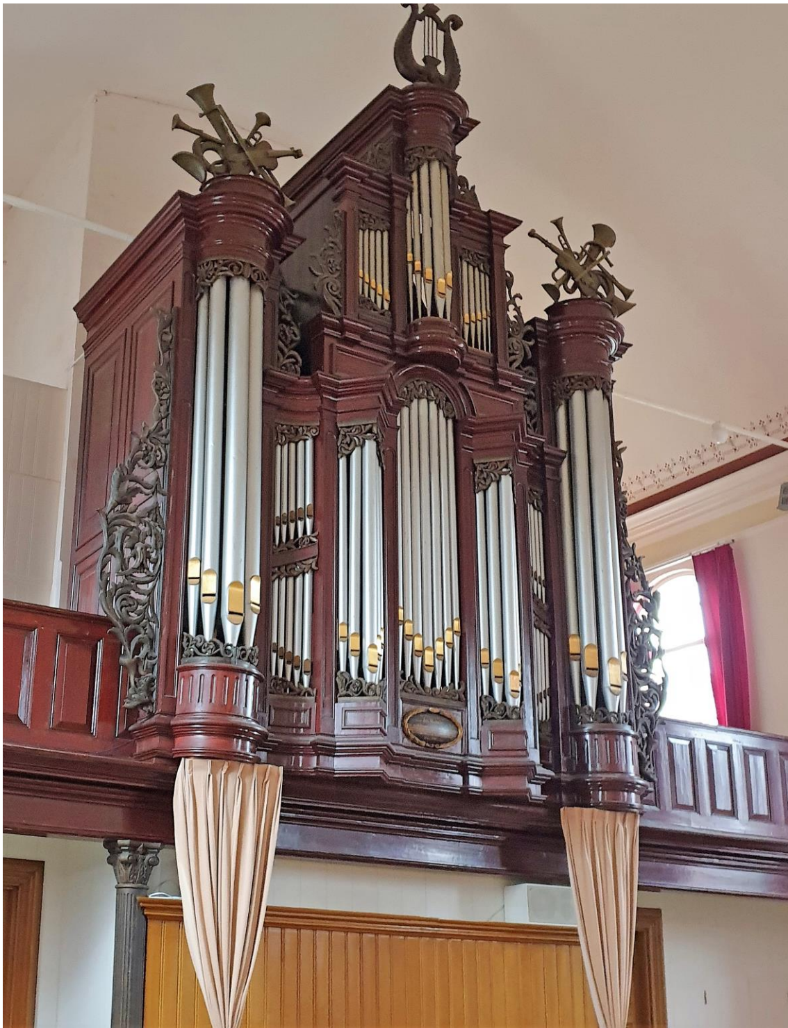
Het monumentale orgel met daaronder de stutpalen, die zijn weggewerkt achter gordijnen.