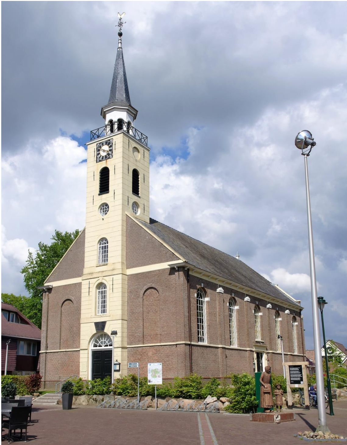
De voorzijde van de kerk met de toren, gelegen aan het dorpsplein